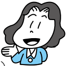
◀お待ちしています!

連絡先: 稲美町国際交流協会 TEL.079-492-1212(内線102) FAX.079-492-5162 E-mail: inami-kokusaikoryu@train.ocn.ne.jp