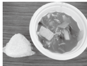
▲稲美町国際交流協会自慢のキムチチゲ&おにぎり