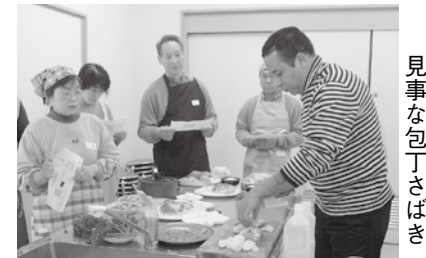
▲ヨセフシェフの 見事な包丁さばき