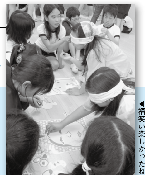
▲福笑い楽しかったね