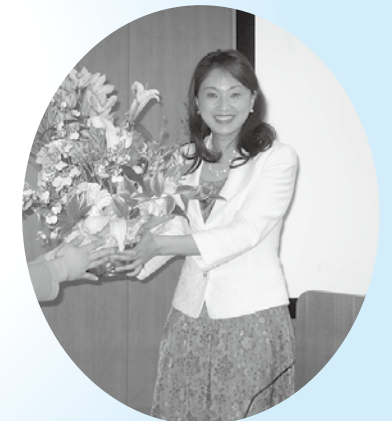
今後のご活躍を期待しています