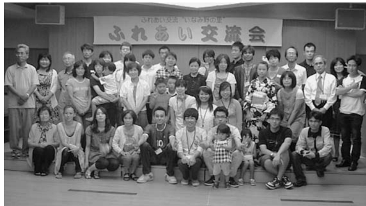
▲稲美町が第2のふるさとになりました