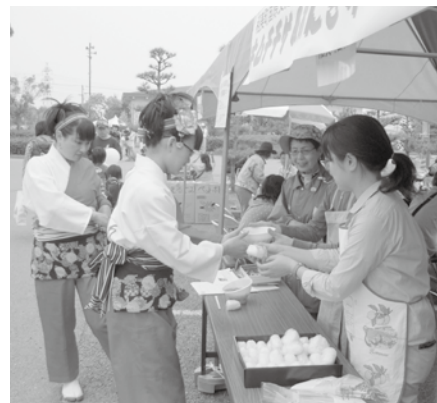
▲今年もまた来たよ!!

「第24回2011稲美ふれあいまつり」に出店し毎回好評の「キムチチゲ&おにぎり」を販売しました。「お肌がプルプルになるよ～」との販売員の威勢のいい呼び込みとその顔の色艶?に納得されたのか、たくさんの方々にご来店いただき用意した200食はお昼過ぎに完売しました。