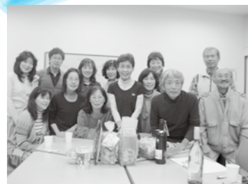
賞品ゲットし、笑顔で記念撮影

基礎英会話講座では2012年最後の授業となった12月18日（火）いきがい創造センターワーキングスペースで14人の方が参加されXmasパーティを開催しました。まず、それぞれが1番心に残った出来事をスピーチし、その後英語ビンゴ、連想ゲームで盛り上がりました。ワインや外国産の賞品もゲットし、「Have a nice New Year season!」の言葉を残し家路につきました。