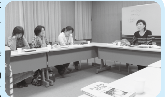
きょうは形容詞の使い分けを学習中!

また、ボランティアの日本語講師の授業相談やブラッシュアップのため、専門家による支援講座を年に5回実施し、近隣にお住まいの講師の方に参加いただいています。