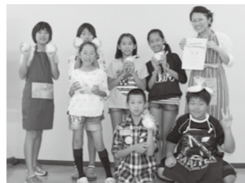
美味しい豚まんのできあがり