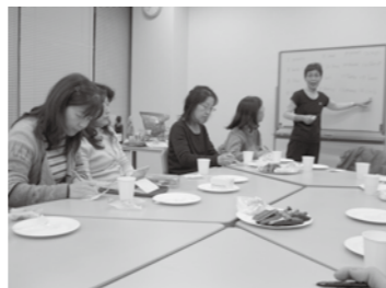
楽しい授業で会話力もアップ

基礎英会話講座では2012年最後の授業となった12月18日（火）いきがい創造センターワーキングスペースで14人の方が参加されXmasパーティを開催しました。まず、それぞれが1番心に残った出来事をスピーチし、その後英語ビンゴ、連想ゲームで盛り上がりました。ワインや外国産の賞品もゲットし、「Have a nice New Year season!」の言葉を残し家路につきました。