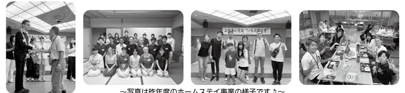
～写真は昨年度のホームステイ事業の様子です♪～

夏休みに大阪大学の留学生と5日間を一緒に過ごしてみませんか?短期間のホームステイ受け入れなので初めての方でも気軽に参加いただけます。日本の大学で勉強している留学生たちは日本語でのコミュニケーションも取れるので色々なお話ができます。大人も子供も良い体験が出来ますよ。